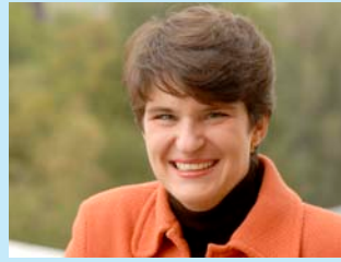
Tanja Gönner (CDU) MdL ist Umweltministerin des Landes Baden-Württemberg